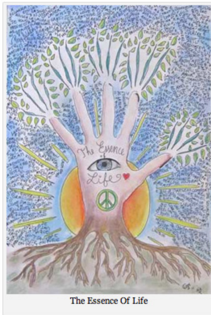
The Essence Of Life

Un jour, elle se fait violemment agresser à Paris.