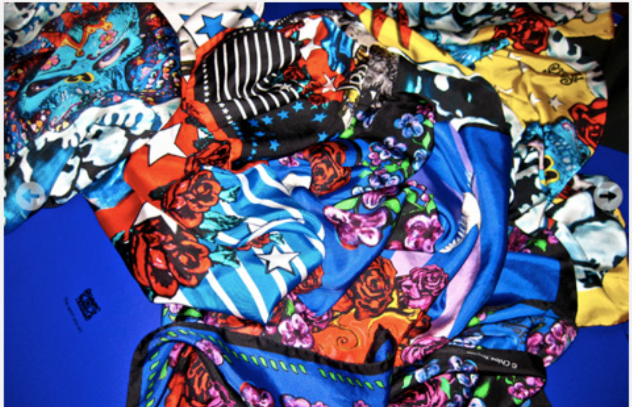
les foulards Chloé Trujillo

Le goût de la mode la rattraperait-elle ?